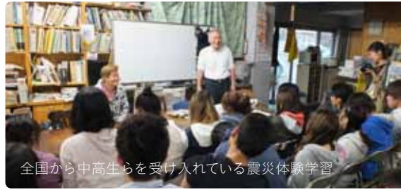
全国から中高生らを受け入れている震災体験学習

[NPO法人 まち・コミュニケーション] http://park15.wakwak.com/~m-comi Tel: 078-578-1100