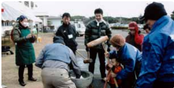
交わりが希薄になりがちな仮設住宅で餅つき大会支援

過剰な救援物資が倉庫に溢れ保管に困る。これは阪神淡路大震災の際にも起きたことだった。復興支援ネットワーク淡路島は当時の経験を活かし、そのままでは廃棄処分するしかない物資を宮城県の被災地から引取り、バザーを開催。「余っていた物」は「お金」に姿を換えて再び被災地へ。現地の豆腐屋さんが月に一度仮設住宅に豆腐を届ける資金にするなど、経済再生につな